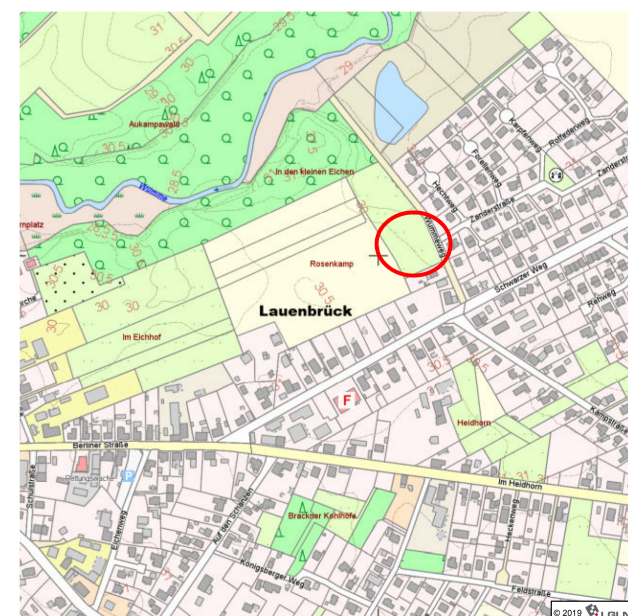
Übersichtsplan aus der AK 5 (1:5.000)

Sollten während der Erdarbeiten vor Ort Bodenverunreinigungen, unnatürliche Bodenverfärbungen oder Abfallablagerungen festgestellt werden, so sind diese dem Landkreis Rotenburg (Wümme), Amt für Wasserwirtschaft und Straßenbau, unverzüglich schriftlich anzuzeigen und die Arbeiten bis auf weiteres einzustellen.