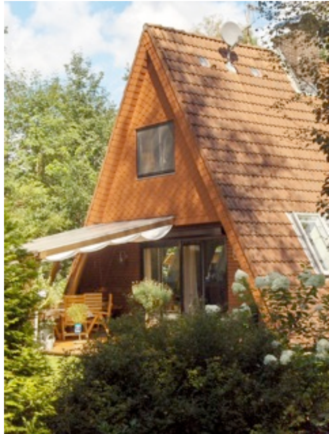
Nurdach-Haus im Wochenendhausgebiet „Zeigelteiche“

Ein Ferien- und Wochenenddomizil im Grünen können sich nicht nur Großverdiener leisten. Im Mobilheimpark Aukamp in Lauenbrück gibt es gebrauchte Mobilheime mit einem Wohn- und zwei Schlafzimmern, Küche und Bad schon ab etwa 12.000 Euro. Neue Mobilheime mit bis zu 40 m 2 Wohnfläche schlagen mit etwa 1.000 Euro pro Quadratmeter zu Buche. Eine Investition, die sich rechnet, weiß Hans-Christian Graf von Bothmer vom Mobilheimpark Lauenbrück. „Moderne Mobilheime sind gut isoliert, sorgfältig geplant und bieten viel Komfort und Wohnqualität für die ganze Familie. Ausgestattet mit Heizung, Strom und Wasseranschluss sind sie das ganze Jahr über nutzbar.“